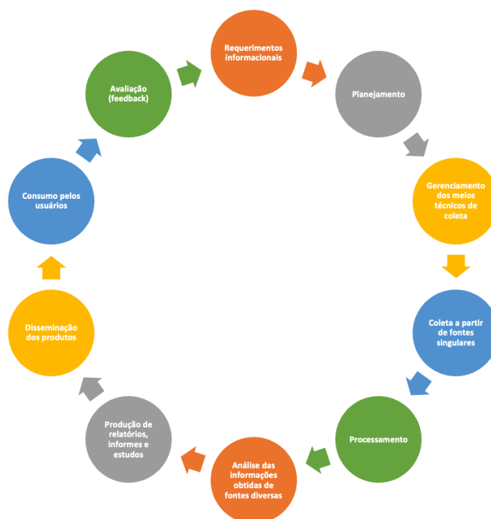
Figura 2.1: Estágios de Coleta, segundo CEPIK

Segundo Marco Cepik, os estágios de coleta ( single-sources collection ) e análise ( all-sources analysis ) são as etapas fundamentais do “fluxo informacional estruturado” denominado Ciclo de Inteligência, que, em sua forma ampliada, possui até dez etapas principais que caracterizam a atividade de Inteligência, na seguinte ordem [23]. A figura 2.1 ilustra estes estágios.